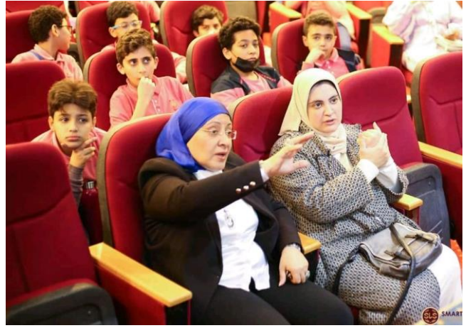
3- قوافل توعويه لنادى المعلمين و بعض الميادين العامه و المواقف العامه